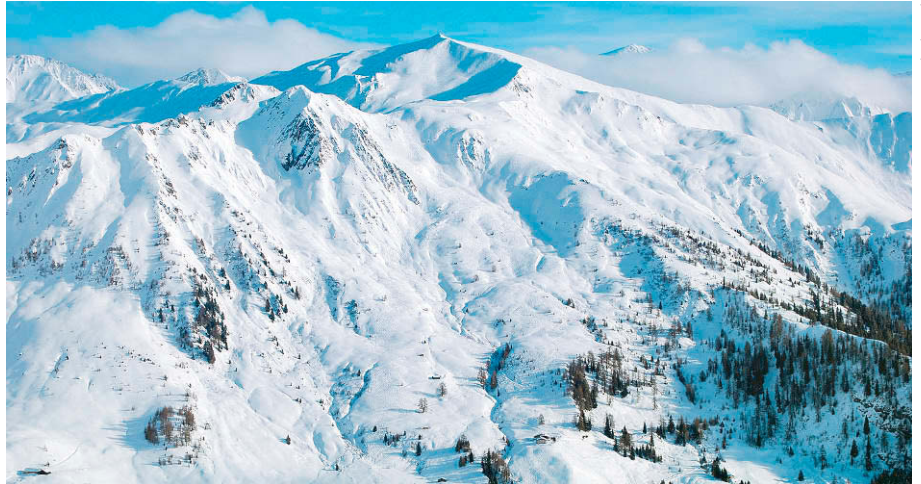
Das Naviser Kreuzjöchl von Nordwesten